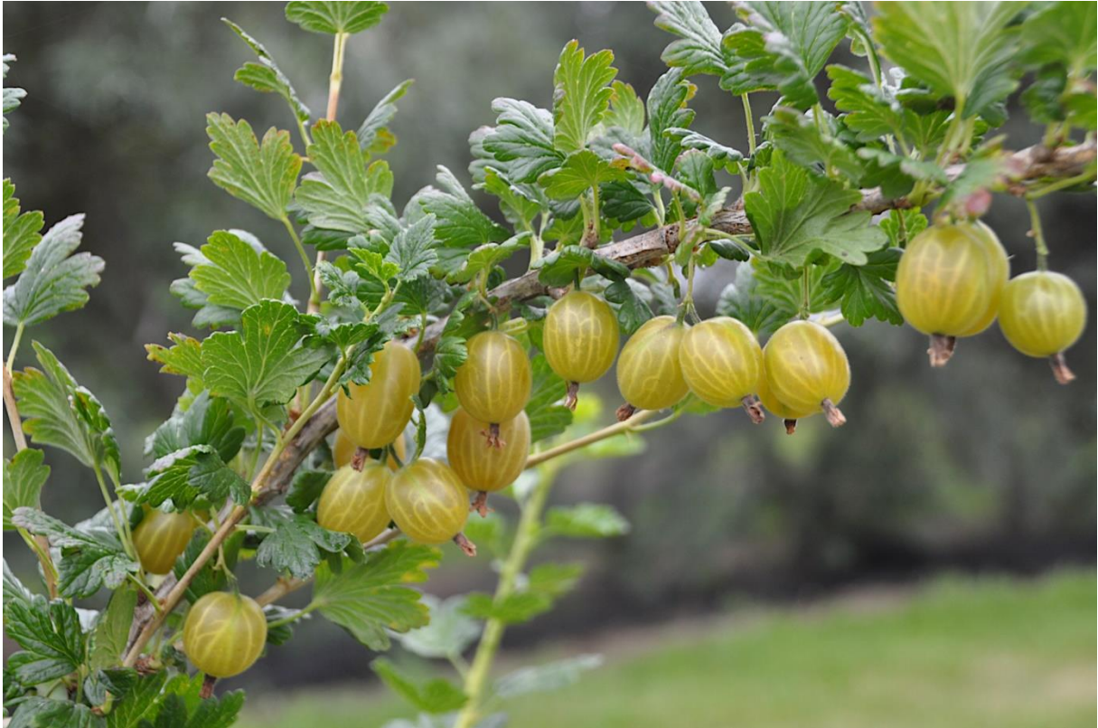
Krusbär 'Dagmar' är en både frisk, god, rikbärande och vacker sort.