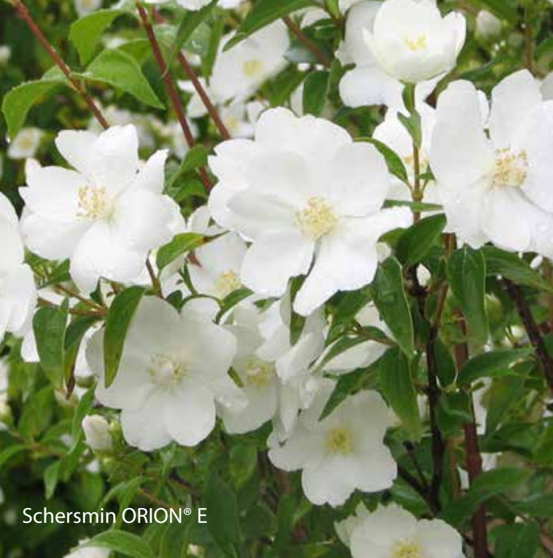
Schersmin ORION® E