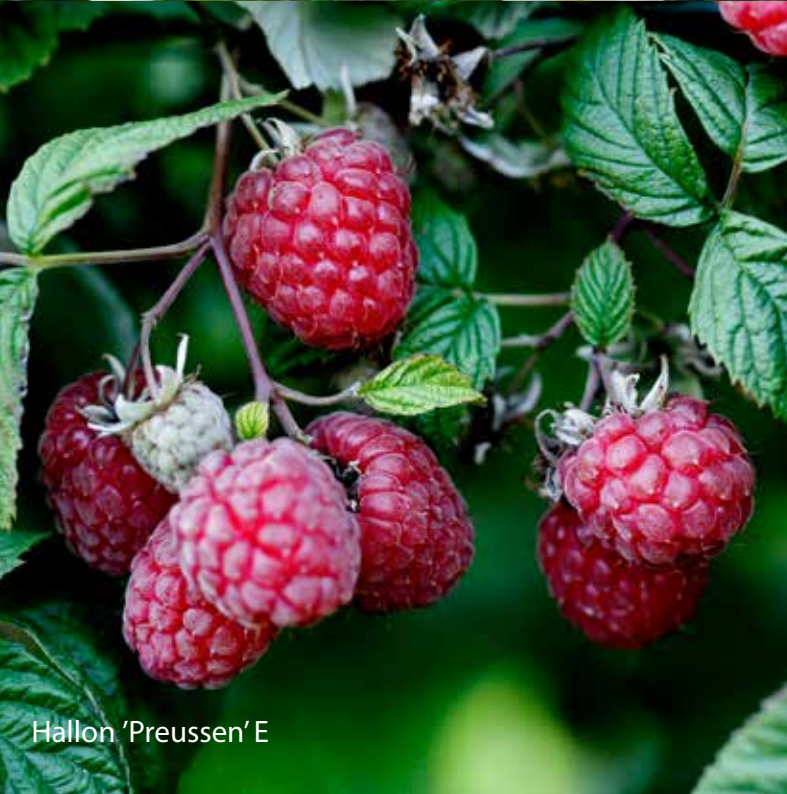
Hallon 'Preussen' E