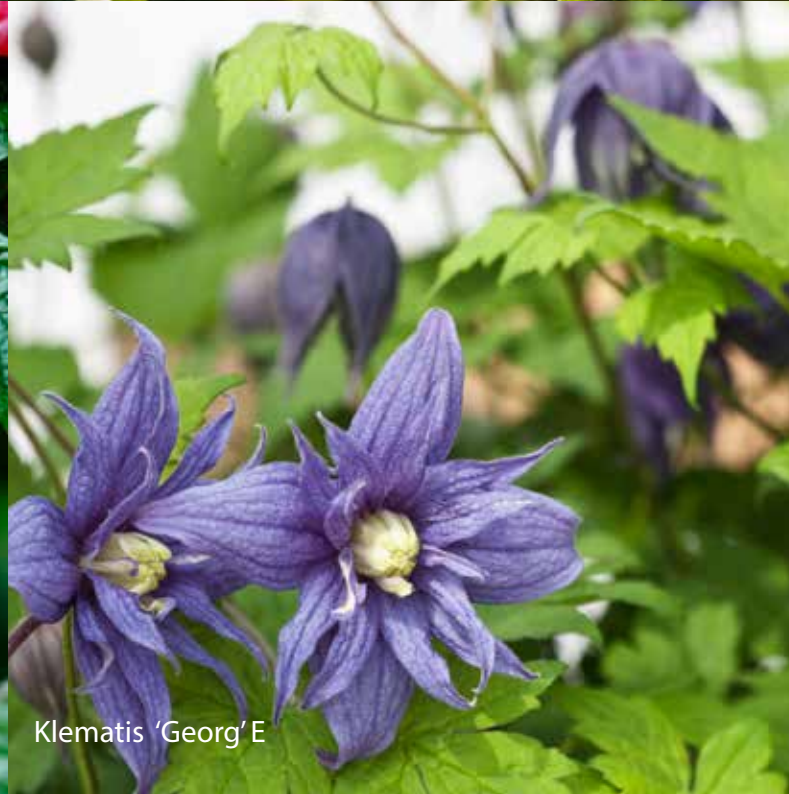
Klematis 'Georg' E